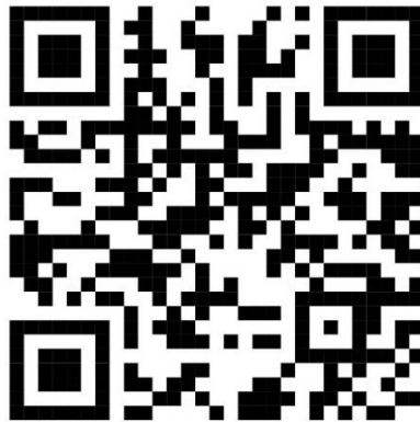
Borang Pendaftaran Alumni PNS